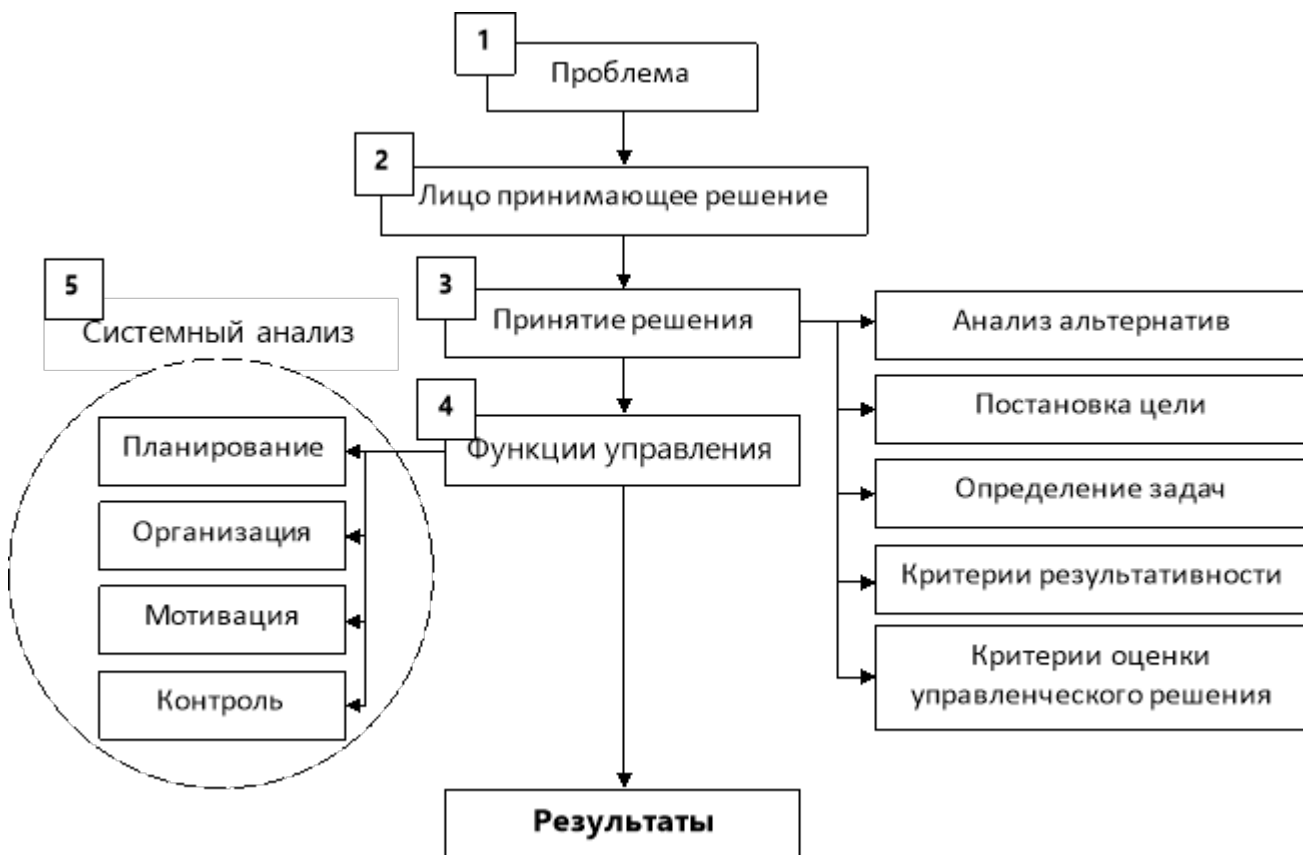
Рисунок 6 – Общая логика проектного управления в общественном секторе

Таким образом, подготовка проекта в общественном секторе должна начинаться с диагностирования проблемы, принятия управленческого решения по ее устранению (с учетом широкого диапазона требований), выбора лица, способного это решение реализовать, планирования и выполнения работ на основании перманентного использования функций управления, объединенных в единой системе (рис. 6). Совокупное использование перечисленных элементов (инструментов) менеджмента позволяет обеспечить контролируруемую энтропийность, т. е. реализовать проект, который действительно улучшить систему, а не решит частную проблему и повлечет непредвиденные негативные последствия, вызванные разрушением каких-либо институциональных связей в управляемой системе.