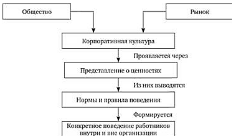
Рисунок 3 - Модель формирования (организационной) корпоративной культуры.[4]

Поддержание организационной культуры – это процесс ее сохранения и укрепления. Как правило, рекомендуется проведение ряда методов, которые направлены на поддержание и укрепление установившихся ценностей. Существует несколько методов поддержания организационной культуры: