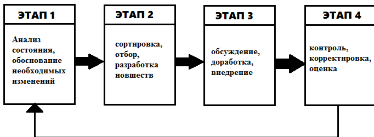
Рисунок 4 - Управление изменениями организационной культуры фирмы. [7]

На каждом из представленных этапов выполняются соответствующие задачи. Рассмотрим более детально.