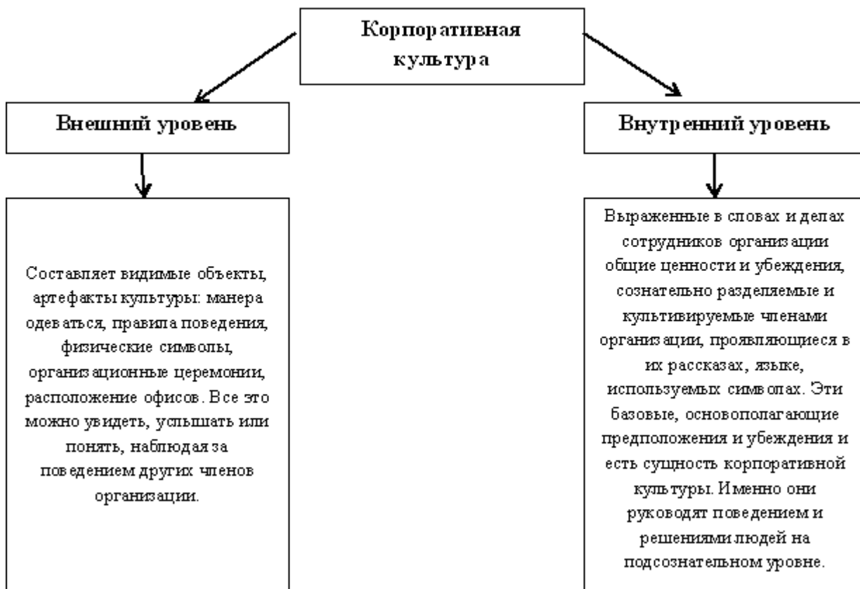
Рисунок 2 – Уровни организационной (корпоративной) культуры по Т. Ю. Базарову. [2]

подразделяет организационная культура на два основных уровня: внешний и внутренний. Он представлен на рисунке 2.