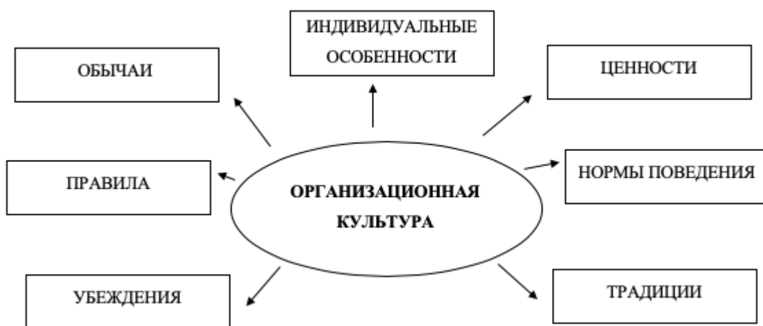
Рисунок 1 – Основные элементы организационной культуры. [1]

Основные элементы организационной культуры представлены на рисунке 1.